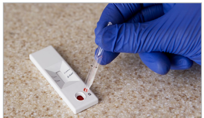
Beim QuickScreen® liegt das Testergebnis nach 15 Minuten vor

Die beiden entscheidenden Tests sind deshalb die Phänotypisierung, um den Pi-Typ festzustellen, sowie die Genotypisierung, um die Veränderung im Gen zu identifizieren. Sehr einfach und für den Arzt kostenlos geht dies mit dem AlphaKit®. Dabei werden einige Tropfen Blut auf ein spezielles Papier gegeben, getrocknet und per Post zu einem Speziallabor geschickt. Neuerdings gibt es auch einen Suchtest, der sofort in der Arztpraxis durchgeführt werden kann, der AlphaKit QuickScreen®. Schon nach 15 Minuten liegt das Testergebnis vor. Ähnlich wie bei einem Schwangerschaftstest verfärbt sich der Teststreifen, wenn im Blut ein Z-Allel vorhanden ist. Ein normales Testergebnis schließt einen PiZZ-Typ aus. Ist der Suchtest auffällig, müssen ergänzend die Phänotypisierung und/oder die Genotypisierung vorgenommen werden. Das Kind kann trotz auffälligem Suchtest gesund sein, denn es könnte wie seine Eltern einen MZ-Typ haben.